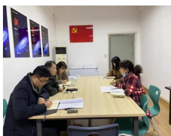
与资产与后勤处交流

通过本轮交流，沟通了思想，加深了大家对评估指标体系的理解和认识，加强了部门之间的联系和协作，为评估工作进一步深入开展奠定了基础。