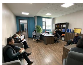
与学校办公室交流