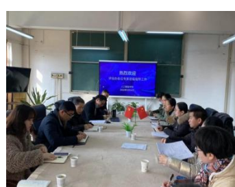
与人工智能学院交流