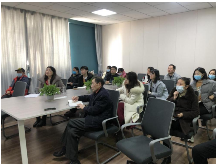
评建办、教务处、人事处及督导室相关人员集中观看讲座