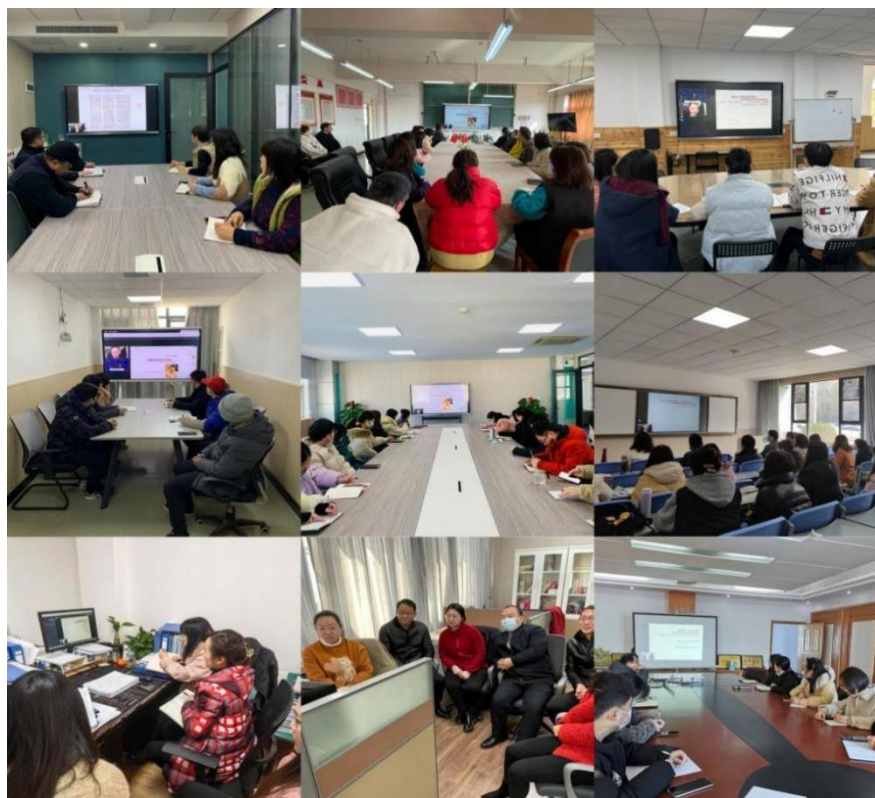
各职能部门和各学院统一组织观看讲座